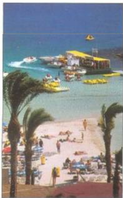
Pláž v rušném letovisku Agia Napa na jihovýchodě Kypru