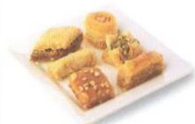
Baklava, typický kyperský zákusek