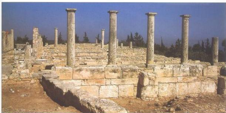
Rozvaliny svatyně Apollona Hylata poblíž Kouria