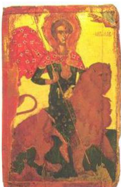
Kyperský svátec Agios Mamas, Byzantské muzeum v Pafu