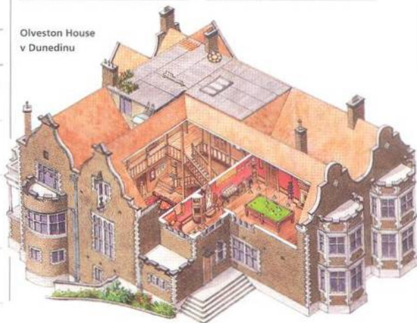
Olveston House v Dunedinu