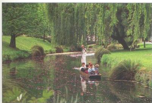
Projížďka na loďce po řece Avon ve městě Christchurch