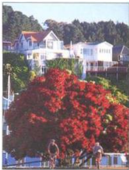
Kvetoucí pohutukawa ( Metrosideros excelsa ) v Oriental Bay, Wellington