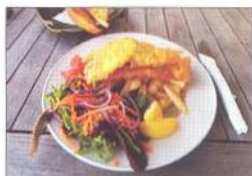
Smažené rybičky se salátem