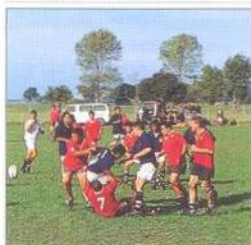
Ragbyový zápas na East Cape na Severním ostrově