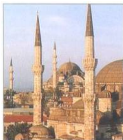
Symbyoly Istanbulu – Hagia Sofia a Modrá mešita