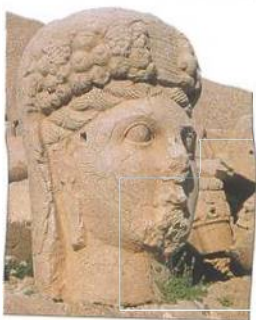
Kommagénská kamenná hlava na toře Nemrut (Nemrut Dağı)