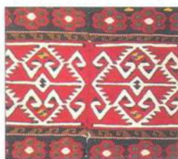
Ukázka turecké tkaniny s geometrickým vzorem