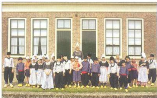
Děti v nizozemských krochích před kostelem v Zuiderzee Museu