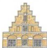
Dům na grachtu ve stylu nizozemské renesance a detaily říms a štítů