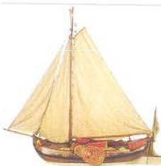
Model lodi v Scheepvaart Museu