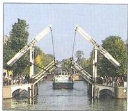
Tradiční zvedací most