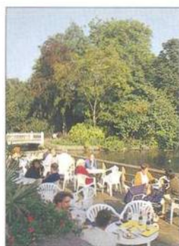
Terasová kavárna v zoo Artis