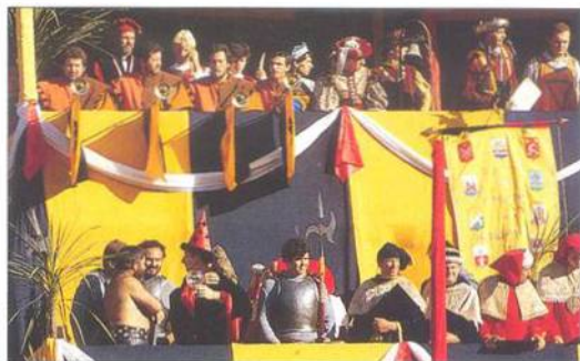
Středověký Palio dei Dieci Comuni v Montagnanè