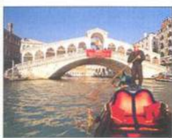
Ponte di Rialto klenoucí se přes Velký kanál