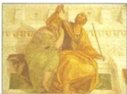
Veronešeho Vášeň a cudnost ve Ville Barbaro v Maséru