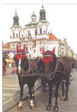
Drožka, Staroměstské náměstí