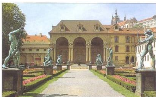
Valdštejnský palác a jeho zahrada na Malé Straně