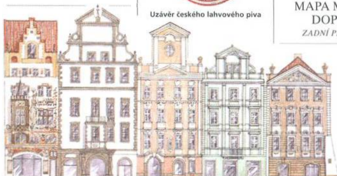
Barokní průčelí domů v jižní části Staroměstského náměstí