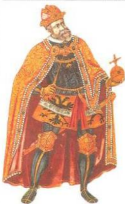
Rudolf II. (1576–1611)