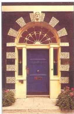
Dveře na Bedford Square (1775)