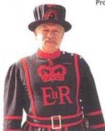
Strážce v Tower of London