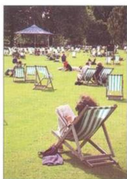
Pódium v St James's Parku