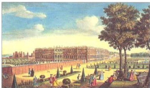
Promenáda na Hampton Courtu (kolem 1720)