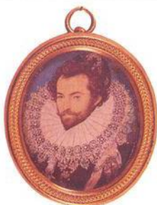
Portrét Sira Waltera Raleigha (1585)