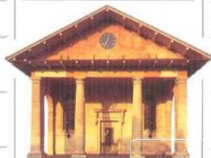
St Paul's Church: Covent Garden