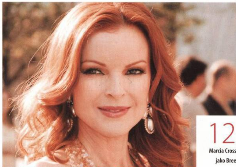
12 Marcia Cross jako Bree

Někdy to bolí, ale znát to, se jistě vyplatí