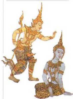
Lakšmana a Síta, postavy z Rámakienu