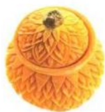
Ozdobně vykrajovaná dýně