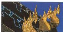
Cho fa na Wat Pan Tao v Chiang Mai