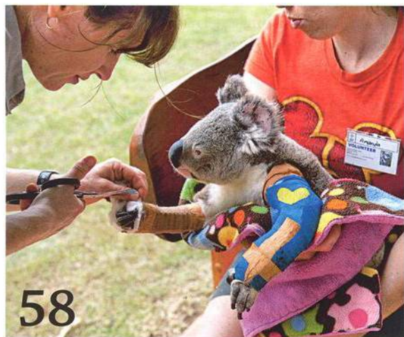
Image plyšového medvídka Teddyho australským koalám příliš nepomáhá, pokud jde o holé přežití – stavební boom a silniční síť je berou do kleští. „Koala Rescue“ je o to víc chrání