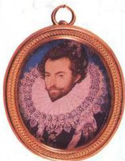
Portrét Sira Waltera Raleigha (1585)