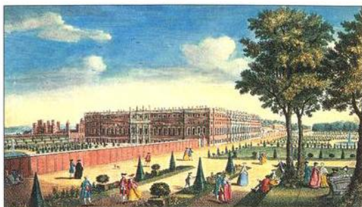
Promenáda na Hampton Court (kolem 1720)