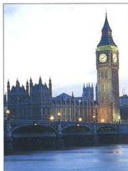
Houses of Parliament