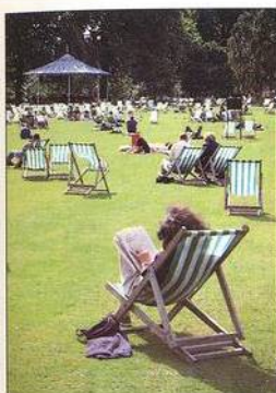
Podium v St James's Parku