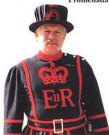
Strážce v Tower of London