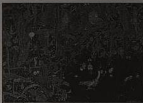
15 | Šumava Josefa Váchala... dřevoryt | Josef Váchal