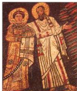
Mozaika v Santa Prassede