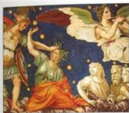
Fresky ve Ville Farnesina