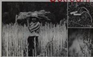
20| Quinoa: svízelný zážrak z polopouště