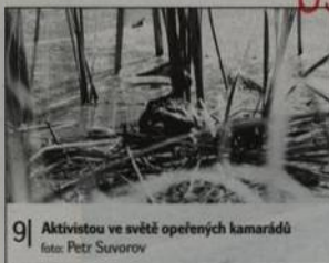
9| Aktivistou ve světě opeřených kamarádů