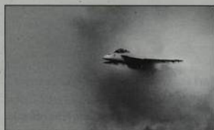
8] Zelenání armády?