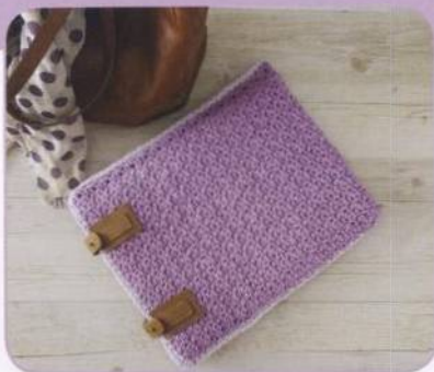
OBAL NA NOTEBOOK | Rebekah Deslogeová 90