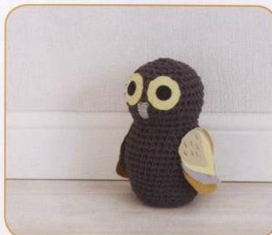
DVEŘNÍ ZARÁŽKA | Nguyen Leová 66