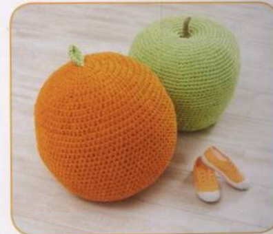
TABURETY | Dedri Uysová 42