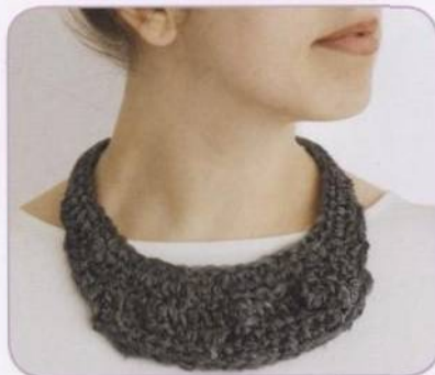
OFICIÁLNÍ NÁHRDELNÍK | Dorothy Woodová 102