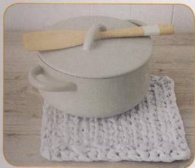
PODLOŽKA POD HRNEC | Michelle Stysová 75