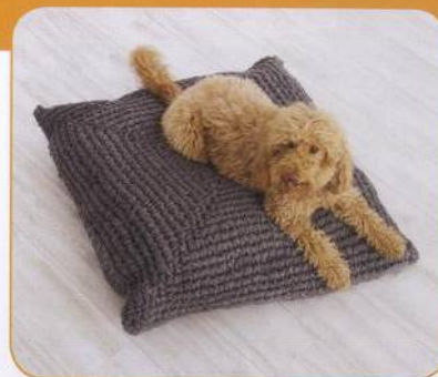
POLŠTÁŘ NA PODLAHU | Cathy Hetzneckerová 58