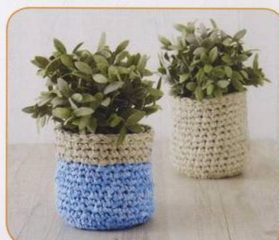
OBAL NA KVĚTINÁČ | Osnat Ganorová 80