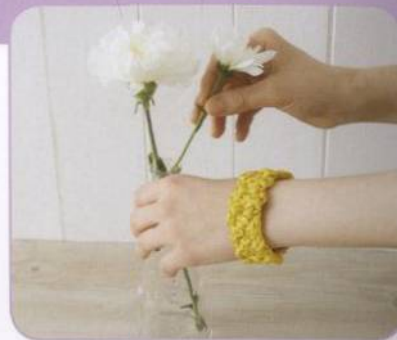
SPLETENÝ NÁRAMEK | Dorothy Woodová 94