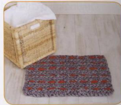
KOUPELNOVÁ PŘEDLOŽKA | Morgan Robertsová 31