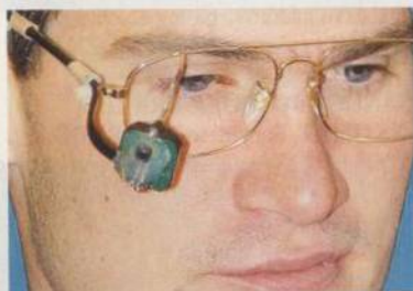
Ovládejte počítač očima!