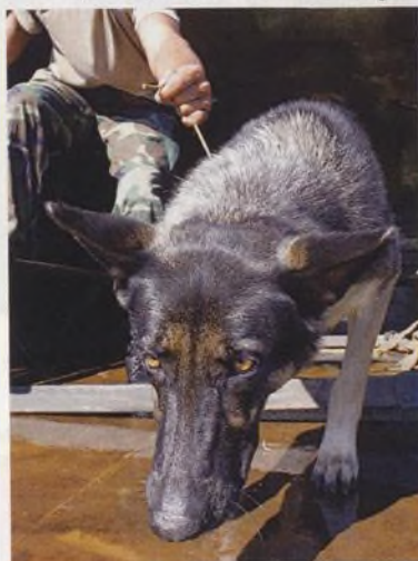
Mohou předvídat katastrofy?