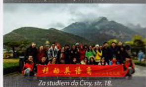
Za studiem do Číny, str. 18