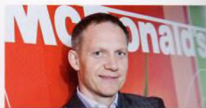
Čtyřlístkový generální ředitel, str. 8