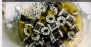
Nano pro vodu i proti vodě, str. 12