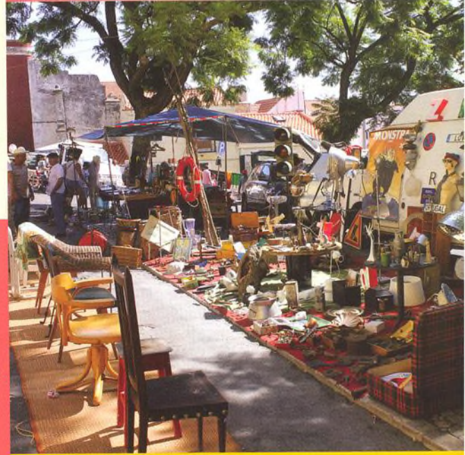
Photo Project: "Treasure Hunt", or the Phenomenon of the Flea Market

Lovci pokladů aneb Fenomén blešního trhu