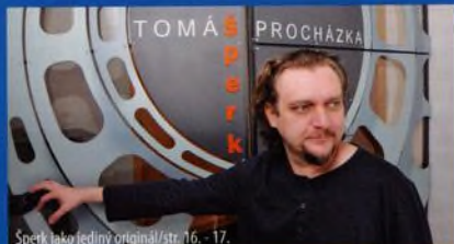
Šperk jako jediný originál/str. 16. - 17.