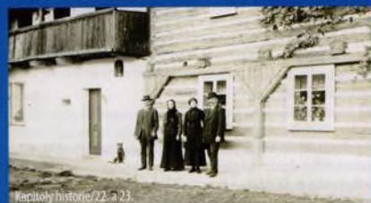
Kapitoly historie/22. a 23.