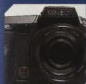
MINOLTA 7Hi 36

Test digitálních fotoaparátů a A4 inkoustových tiskáren