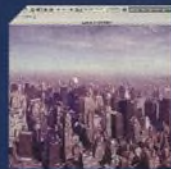
KALIBRACE BÍLÉ BARVY 68