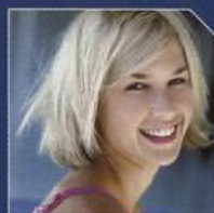
PORTRÉTNÍ FOTOGRAFIE STRANA 22