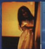
BAREVNÉ ÚPRAVY FOTOGAFIÍ 70