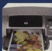
HP PHOTOSMART 7350 43