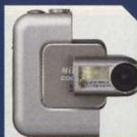
NOVINKY STRANA 10