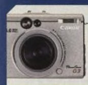
CANON POWERSHOT G3 38