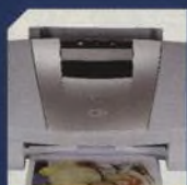
CANON BUBBLEJET S820 43