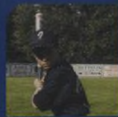
ÚPRAVA TMAVÝCH FOTOGAFIÍ V PAINT SHOP PRO 72