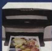
EPSON STYLUS PHOTO 950 43