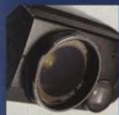
NIKON COOLPIX 4500 40