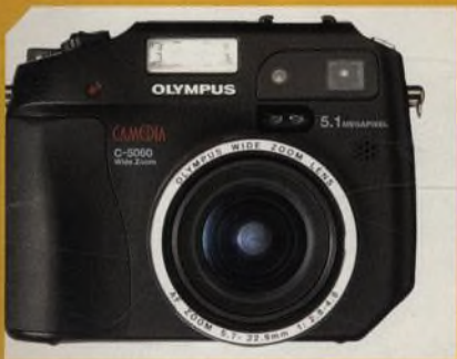
Olympus C-5060W nástupce populárního C-5050 s širším objektivem a dalšími vychytávkami str. 48