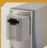
NIKON COOLSCAN 5000ED str. 52