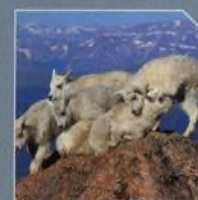
ZOOM STRANA 06