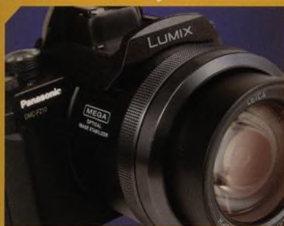
Panasonic Lumix DMC FZ10 nabízí čtyřmegové rozlišení a unikátní objektiv str. 36