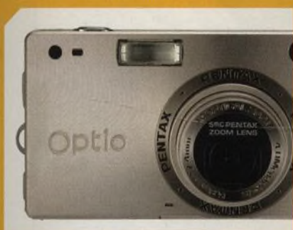
Pentax Optio S4: čtyřmegapixelové ultratenké provedení digitálního fotoaparátu str. 46