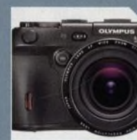
NOVINKY STRANA 10