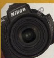
NIKON COOLPIX 8700 str. 50