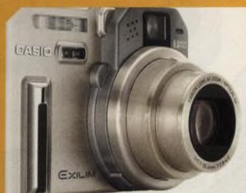
Casio EX-P600, šestimegapixelový kompaktní fotoaparát str. 38