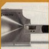
KYOCERA FINECAM SL300R str. 46