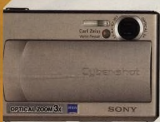
Sony Cybershot T1, kompaktní fotoaparát s rozlišením pět megapixelů str. 42