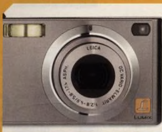
Panasonic Lumix DMC FX5, kompaktní fotoaparát se stabilizátorem str. 44