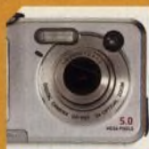
CASIO QR51 str. 48