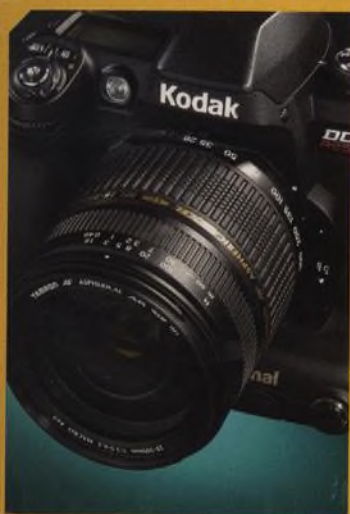
Kodak DCS 14n, profesionální čtrnáctimegapixelová zrcadlovka str. 34