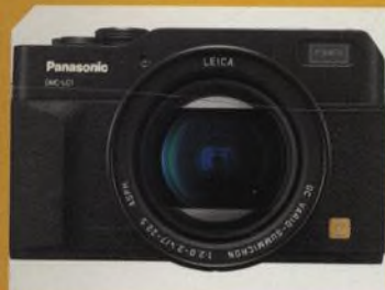
Panasonic LC1, pětimegový digitál s retro designem a objektivem Leica str. 30