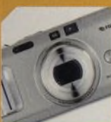
FUJIFILM FINEPIX F710 str. 42