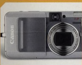
Canon S60 pětimgapixelový kompak se širokoúhlým objektivem str. 44