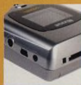
FOTOBANKY str. 50