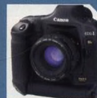
NOVINKY STRANA 12