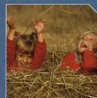
ZOOM STRANA 6