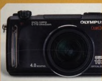
Olympus C-770 čtyřimgegový ultrazoom s MPEG-4 videozáznamem str. 46