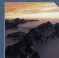
ZOOM STRANA 6