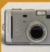
PENTAX OPTIO S30 str. 52