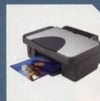
NOVINKY STRANA 12