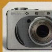
SONY DCS W1 str. 54