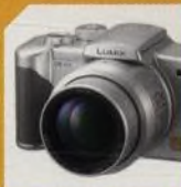
PANASONIC LUMIX FZ3 str. 58