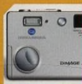
KONICAMINOLTA XG31 str. 50

Pěťmegapixelový kompakt od Nikonu s asférickým objektivem str. 48