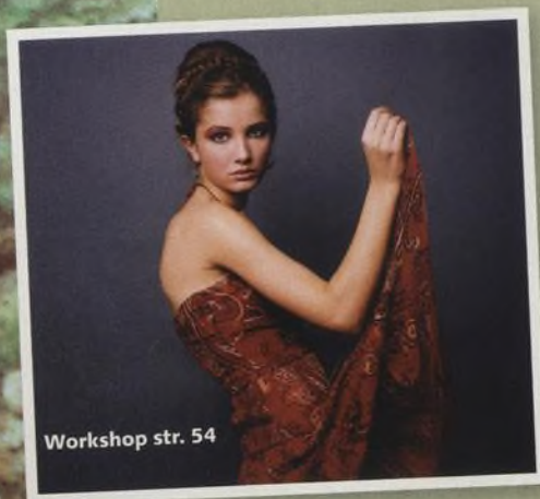
Workshop str. 54

Podívejte se, jak to dopadne, když se v jednom ateliéru potkají dva fotografové