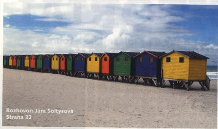
Rozhovor: Jára Soltysová Strana 32