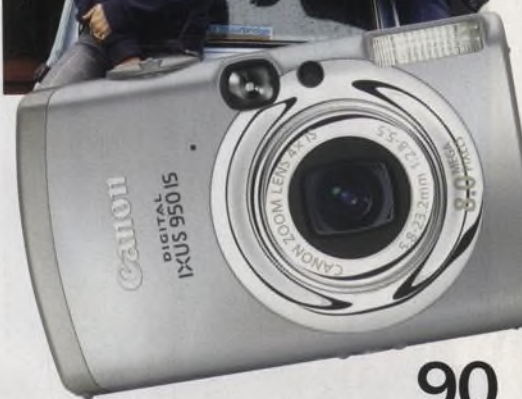
90 Canon Digital Ixus 950 IS Představujeme nejnovější přírůstek stylové řady