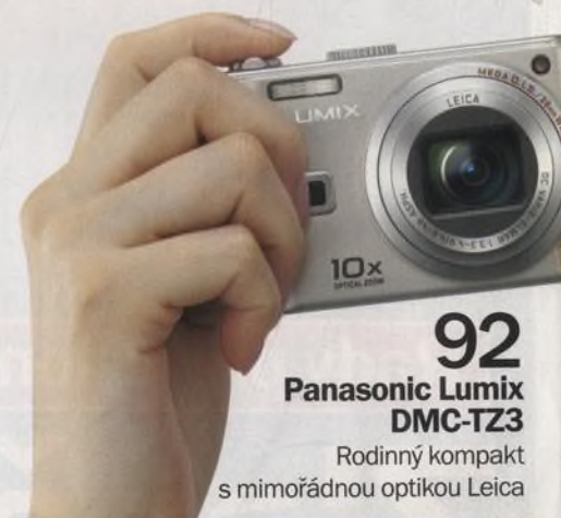
92 Panasonic Lumix DMC-TZ3

Rodinný kompakt s mimořádnou optikou Leica