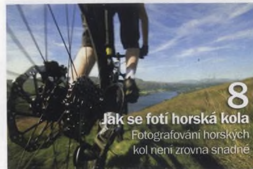
8 Jak se fotí horská kola Fotografování horských kol není zrovna snadné