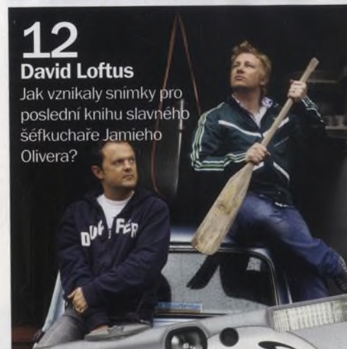
12 David Loftus Jak vznikaly snímky pro poslední knihu slavného šéfkuchaře Jamieho Olivera?