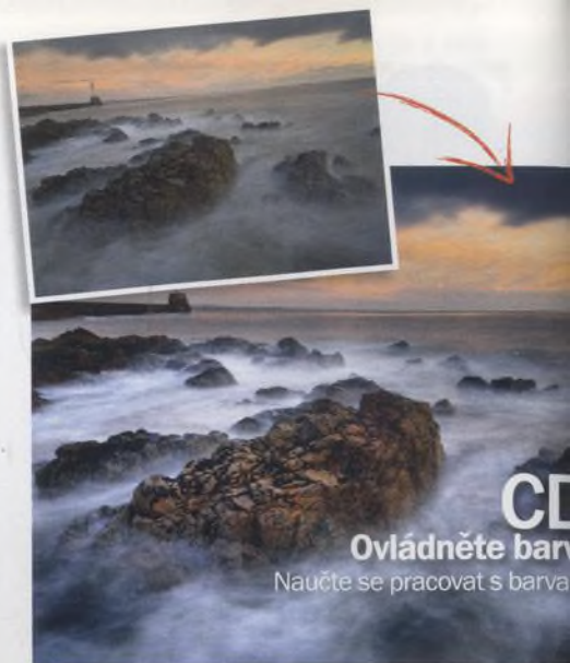
CD Ovládněte barvy Naučte se pracovat s barvami