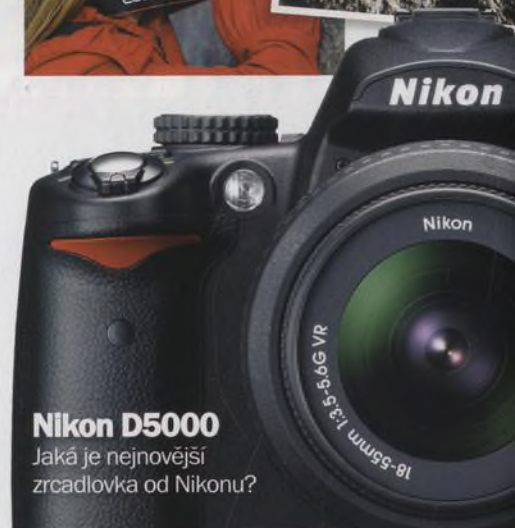
Nikon D5000 Jaká je nejnovější zrcadlovka od Nikonu?