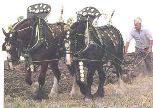
ORAJÍCÍ SHIRŠTÍ KONĚ