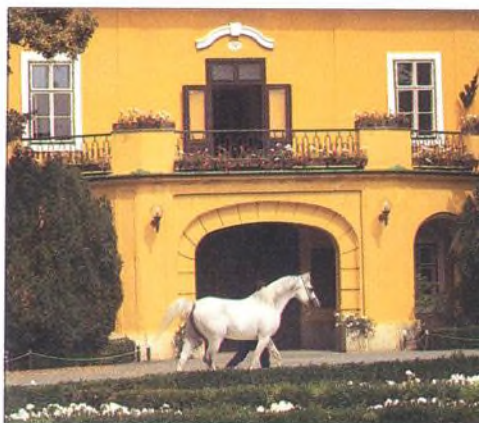
HŘEBČIN V BÁBOLNĚ, MAĎARSKO