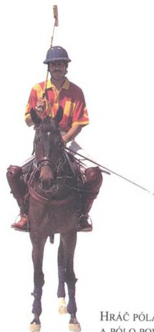
HRAČ PÓLA A PÓLO PONY