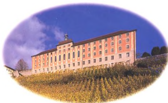
Rieschen Vineyard, Meersburg, Německo

Úvod do německých vín 260 Ahr 270 Střední Rýn 272 Mosel-Saar-Ruwer 274 Nahe 278