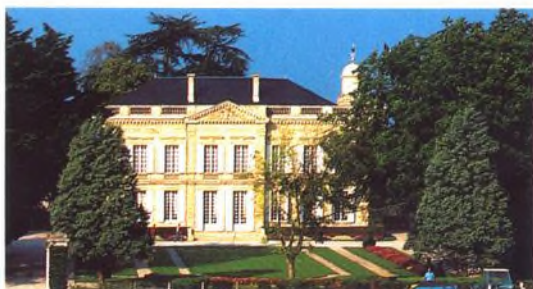
Château Gruaud-Larose, St.-Julien, Francie