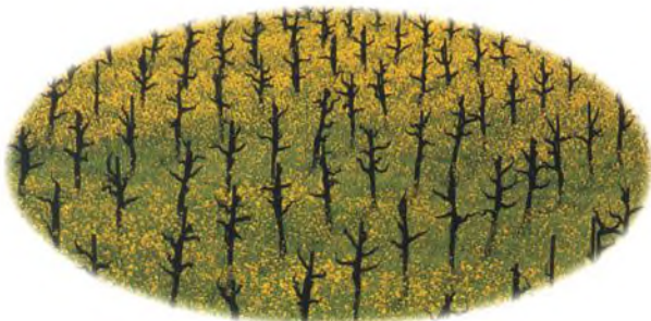
Rozkvetlá bořčice a réva na jaře, Napa Valley, Kalifornie, USA