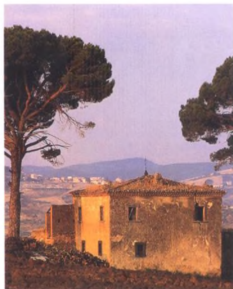
Conca d'Oro estate, Vulture, Basilicata, Itálie

Úvod do italských vín 306 Severozápadní Itálie 310 Severovýchodní Itálie 319 Střední Itálie - západ 326 Střední Itálie - východ 333 Jižní Itálie a ostrovy 336 AUTORŮV VÝBĚR 344