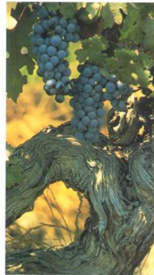
Odrůda Cabernet sauvignon, Chile