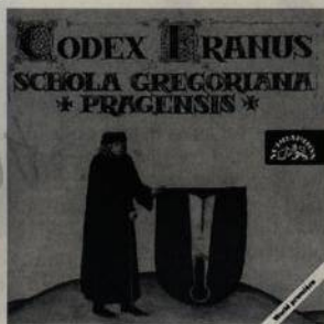
Codex Franus Schola Gregoriana Pragensis Supraphon (str. 50)