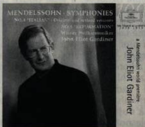
Mendelssohn Symfonie č. 4 a 5 Gardiner, WP Deutsche Grammophon (str. 45)