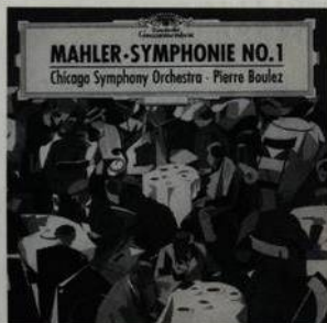
Mahler Symfonie č. 1 Boulez, Chicago Sym. Orch. Deutsche Grammophon (str. 43)