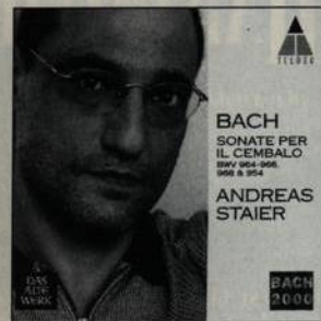
Bach Sonáty pro cembalo Staier Teldec (str. 39)