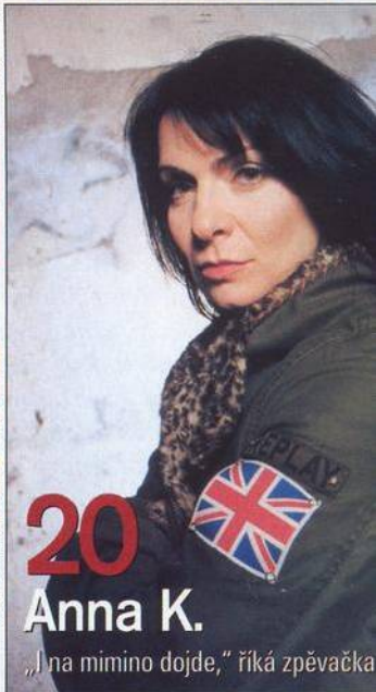
20 Anna K. „I na mimino dojde,“ říká zpěvačka