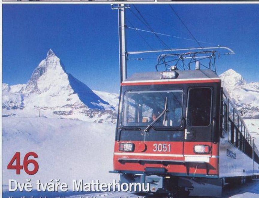
46 Dvě tváře Matterhornu Ve střediscích pod legendární horou právě začala sezona