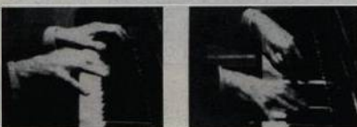
Virtuózní ruce Bély Bartóka

Výročí měsíce - Béla Bartók (Luboš Stehlík)