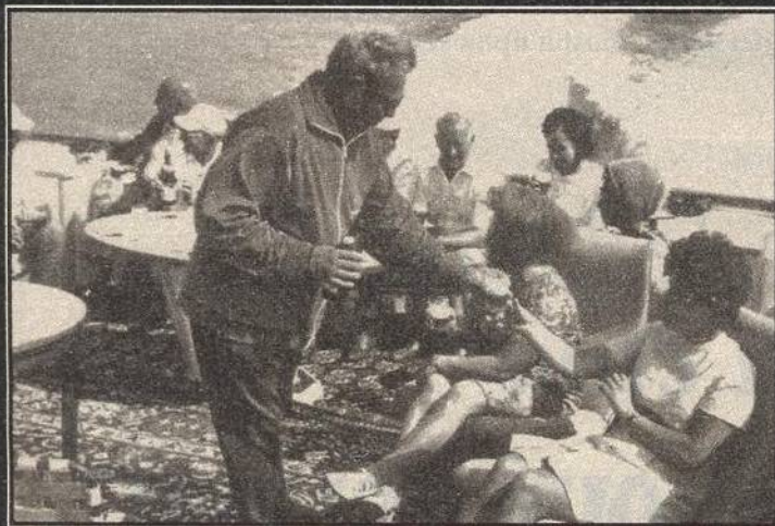
Repro z knihy Rusko 20. století

O tom, jak skutečně vypadá odvrácená strana Ruska, vypráví kniha Rusko 20. století. Unikátní fotografie ze zabezpečených archivů dokumentují zemi géniů i gangsterů. Na snímku L. I. Brežněv na lodi vyložené perskými koberci.