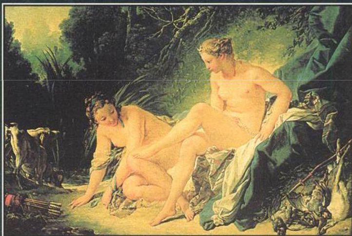
Repro z knihy Umenie v dejinách človeka

„Kdo nežil před rokem 1789, ten neví, jak je život sladký,“ řekl kníže Talleyrand . Jeho slova patřila životnímu a kulturnímu stylu, jež známe jako rokoko . Byl rozkošnický, hravý, ale také rafinovaný a vynalézavý.