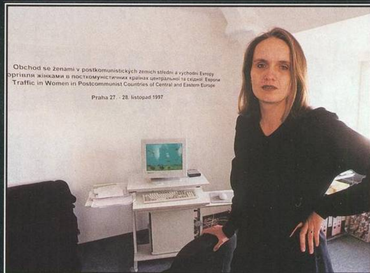
Obchod se ženami v postkomunistických zemích střední a východní Evropy Обрипши жінками в посткомуністических країнах центральної та східної Європи Traffic in Women in Postcommunist Countries of Central and Eastern Europe Praha 27. 28. listopad 1997