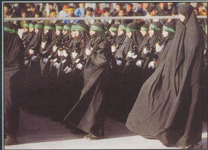
Repro z časopisu LE VÍF 5/83

Přelom tisíciletí zastihuje Evropu a muslimský svět v úzkém kontaktu. V době, kdy se v západních společnostech šíří kulturní rozvolnění, však v muslimských zemích nabývají na síle opačné radikální proudy.