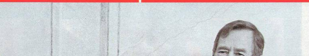
NA TITULNÍ STRANĚ VÁCLAV A DAGMAR HAVLOVI.