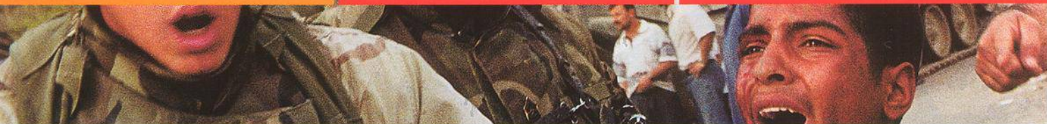
NA TITULNÍ STRANĚ POSTŘELENY IRÁČAN V BAGDÁDU.