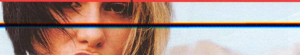
NA TITULU ZPĚVAČKA LENKA DUSILOVÁ.