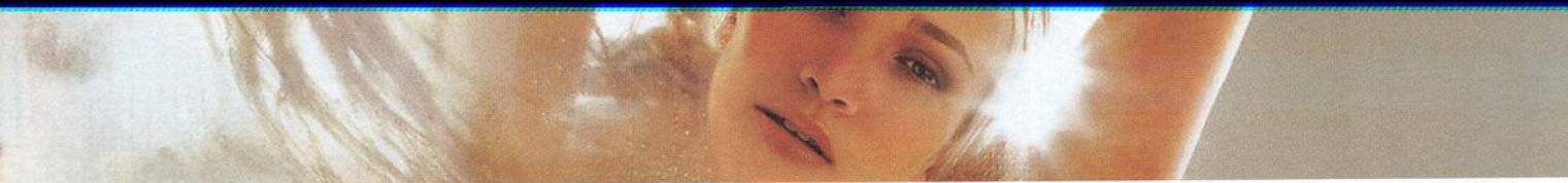
NA TITULU AMERICKÁ HEREČKA JENNIFER LOPEZOVÁ.