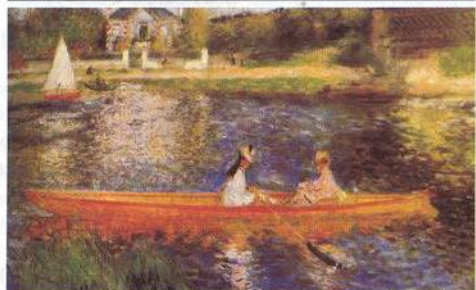
REPRO Z PUBLIKACE AUGUSTE RENOIR

28 Technosmrt za úplňku Na thajském ostrově se náš reportér ocitl v žáru taneční party