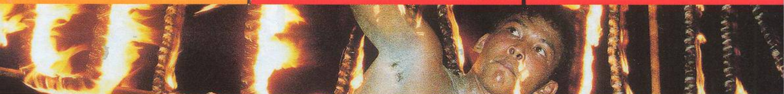
NA TITULNÍ STRANĚ ZÁBĚR Z FULL MOON PARTY V THAJSKU.