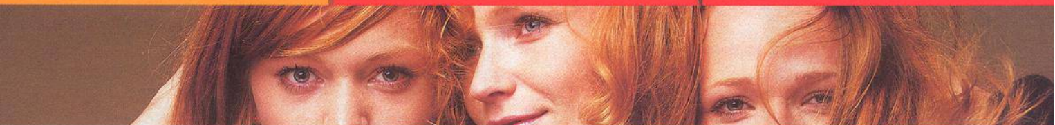
NA TITULU ESTER, AÑA A LELA GEISLEROVY.