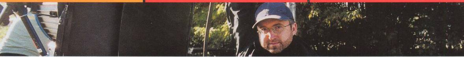
NA TITULU REŽISÉR JAN HŘEBEJK.