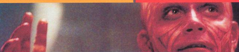
NA TITULNÍ STRANĚ ROBBIE WILLIAMS.