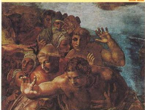
REPRO L'OPERA COMPLETA DI MICHELANGELO PITTORE